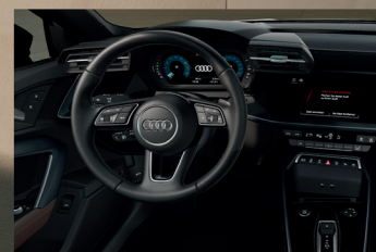
▶ Controle de Cruzeiro Adaptativo (ACC)