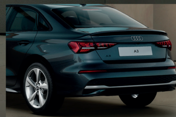
▶ Audi Side Assist