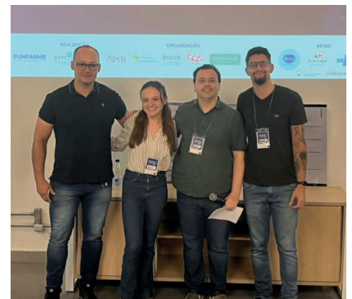
Vice-campeões do desafio “Melhorar a jornada da pessoa neurodivergente”