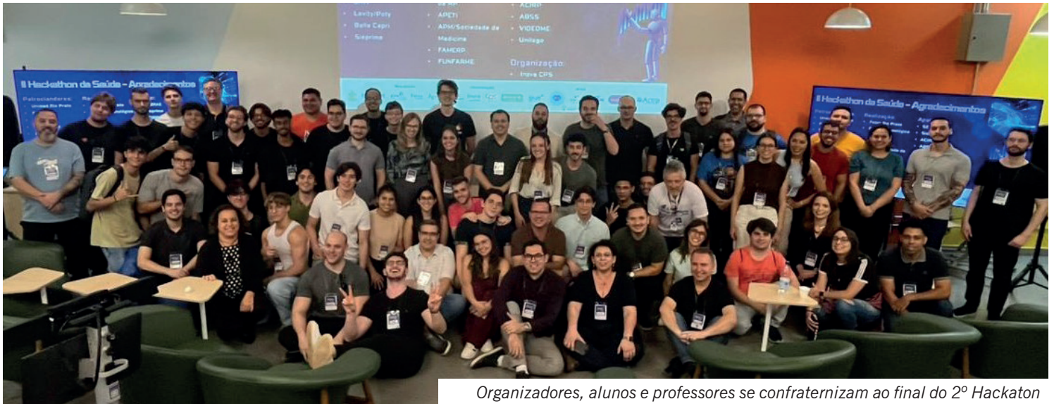
Organizadores, alunos e professores se confraternizam ao final do 2º Hackaton

O 2º Hackathon da Saúde em Rio Preto, realizado pela APM de Rio Preto, foi um sucesso, reunindo mais de 120 alunos e professores de medicina, TI e gestão. Divididos em 13 times, eles tiveram que escolher entre dois desafios para desenvolverem projetos inovadores: uma para melhorar a cobertura vacinal e o outro para aprimorar a jornada da pessoa neurodivergente e sua rede de apoio. Para viabilizar o evento, a APM contou com a parceria da Funfarme, Famerp, Fatec, Apeti e Centro Paula Souza.