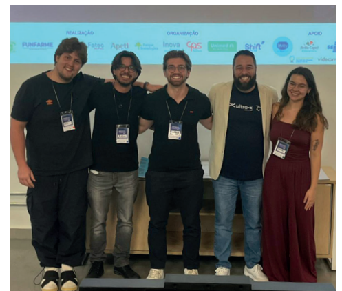
Equipe vice-campeã do desafio “Melhorar a cobertura vacinal”