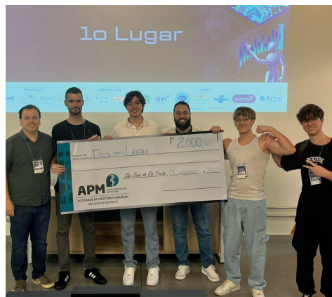
Equipe campeã o desafio “Melhorar a jornada da pessoa neurodivergente”