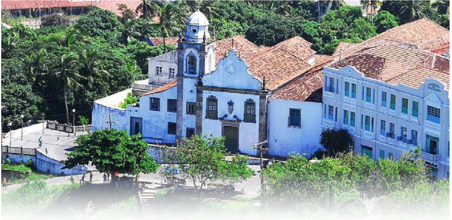
Fundada em 1540, a Santa Casa de Misericórdia de Olinda foi o primeiro hospital do Brasil e funcionou em prédio anexo à Igreja da Misericórdia

A palavra hospital é de raiz latina (Hospitalis), vem de “hospes” - hóspedes, porque antigamente nessas casas de assistência eram recebidos peregrinos, pobres e enfermos. O termo hospital tem hoje a mesma acepção de nosocomium, de fonte grega, cujo significado é tratar, receber os doentes. Hospitium era chamado o lugar em que se recebiam hóspedes. Deste vocábulo derivou-se o termo hospício, cuja palavra foi consagrada especialmente para indicar os estabelecimentos ocupados permanentemente por enfermos incuráveis e insanos. Sob o nome de “hospital”, ficaram designadas as casas reservadas para o tratamento temporário dos enfermos.