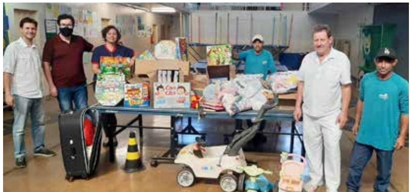
A Associação Renascer atende 300 pessoas com deficiência intelectual ou física, Síndrome de Down, portadoras de doenças neurológicas, entre outras.