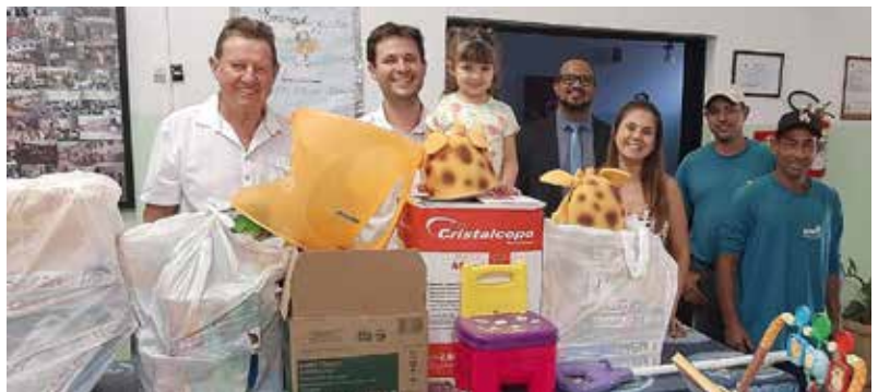
A Associação Espírita Paulo de Tarso atende famílias em vulnerabilidade social dos bairros Vila Toninho, Brejo Alegre, João Paulo II e Jardim Santo Antônio