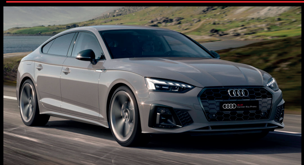
Audi A5 S-line 23/23