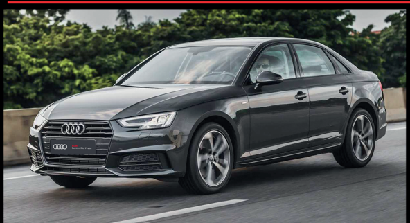
Audi A4 S-line 23/23