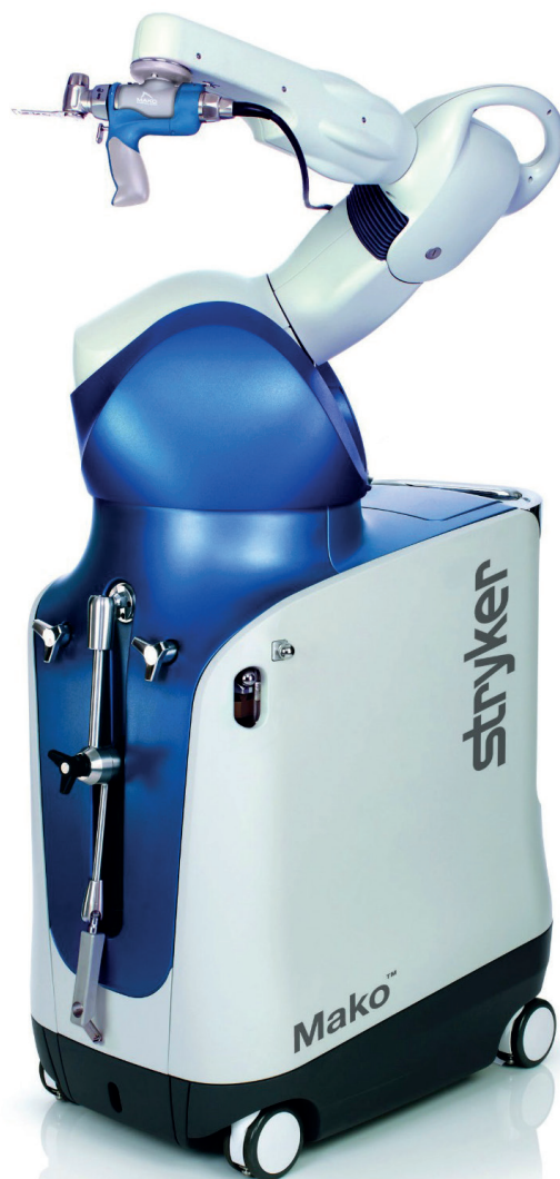
Robô Mako: tudo de bom para o seu joelho, quadril e tudo mais

(Texto: Hospital Beneficência Portuguesa)