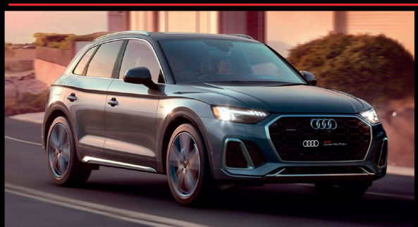
Audi Q5 S-line 23/23