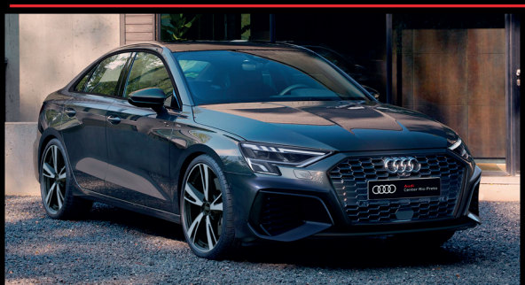
Audi A3 Sedan Performance Black 23/23